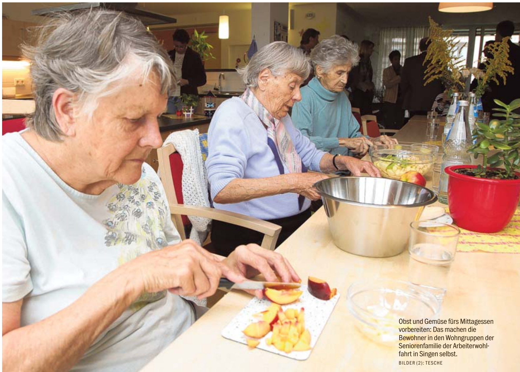
Obst und Gemüse fürs Mittagessen vorbereiten: Das machen die Bewohner in den Wohngruppen der Seniorenfamilie der Arbeiterwohlfahrt in Singen selbst.